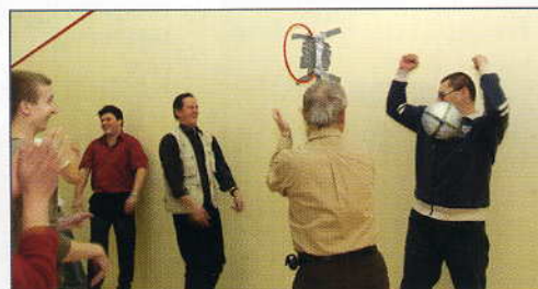
Seznámit se navzájem – rozhybat a pobavit se, to mohli účastníci setkání při četných soutěžích mezi jednotlivými workshopy...