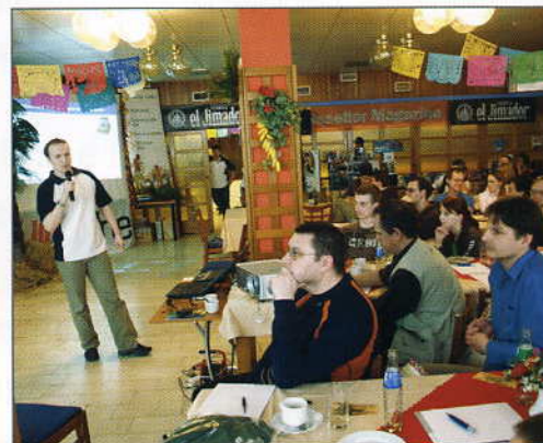
Nechyběla přednáška na téma registračních pokladen – o novém byznysu, který přináší legislativa