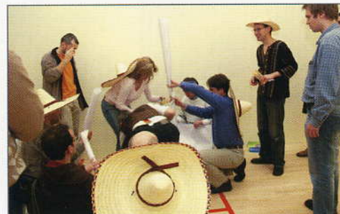
...hrála se pelota – tlachtli, účastníci stavěli pyramidu nebo ochutnávali tequila