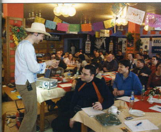
Pozorní posluchači sbírali za správné odpovědi ATC pesos