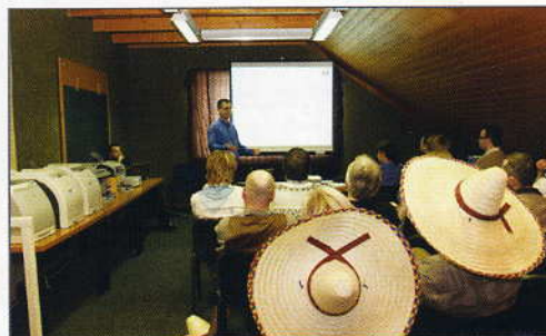
Při workshopu HP – divize IPG – byla představena nová tisková řešení